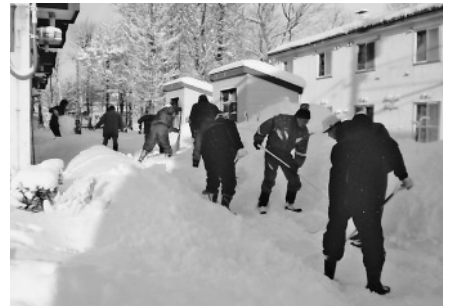
↑写真：町内会による除雪支援の様子

除雪支援活動は、冬期間でも安心して生活ができるよう見守りと安否確認も兼ねた地域住民同士が支え合う活動としてすすめられてきましたが、支援を必要とする人が年々増加するなか、支援する側も高齢化が進んでおり、今後、支え合いをどのようにすすめていくのかが地域の課題となっています。