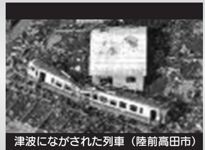
津波にながされた列車 (陸前高田市)

本フォーラムでは、未曾有の大震災に見舞われた岩手県における震災被害状況や弱者対策について報告を聞き、いざという時のために、地域のつながりと顔が見える関係をどのようにしてつくっていけばいいのか、考える機会とします。