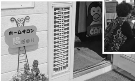
↓ 写真：玄関前に設置された看板

そこで、身近で気軽に集まれる場所をつくりたいという思いから自宅を開放したサロン開設に至りました。