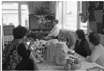
↑ 写真：思い思いに過ごす参加者