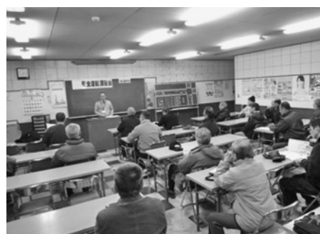
千歳自動車学校の全面的な協力をいただきました