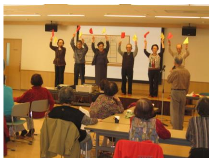
↑写真：旗上げゲームで頭の体操