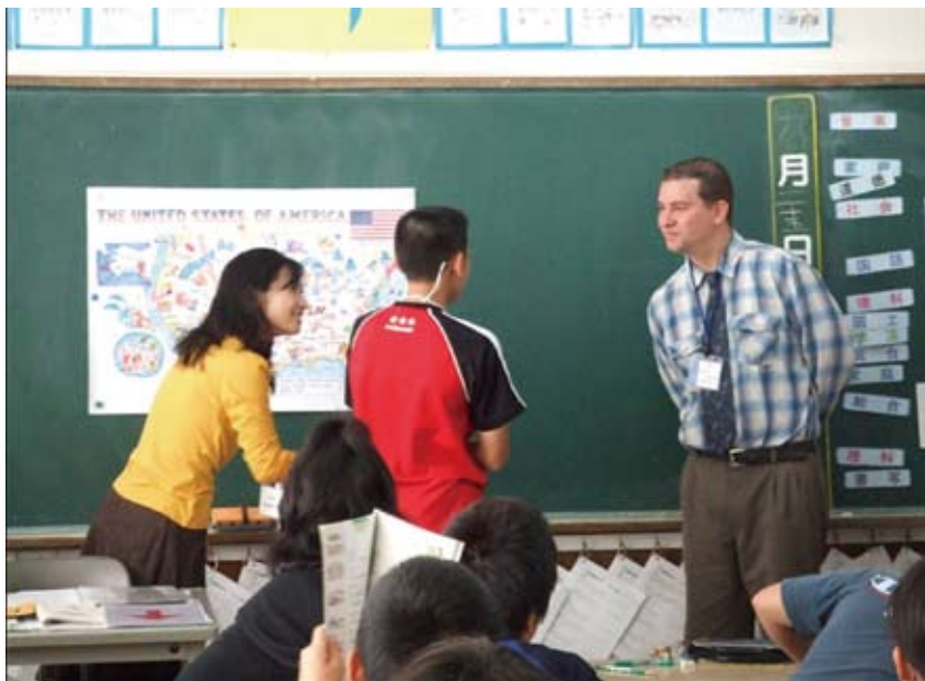
小学校での英語授業