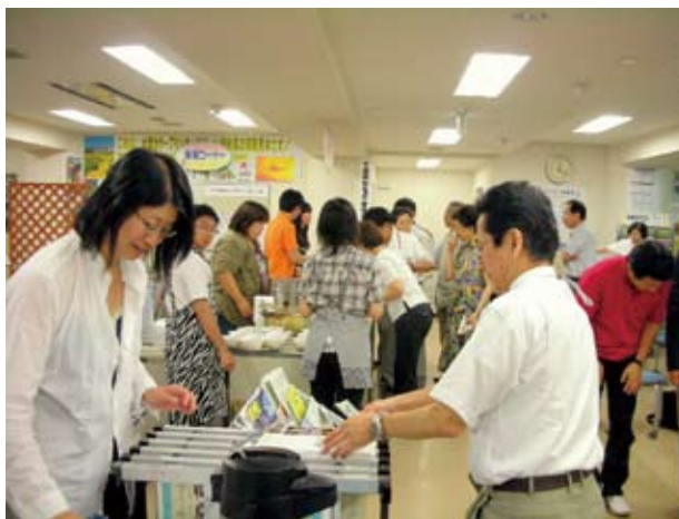
市民活動交流センター「ミナクール」