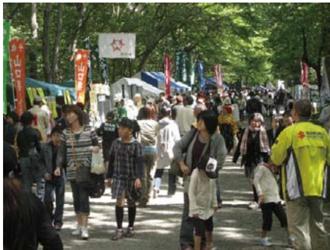
生涯学習まちづくりフェスティバル 「ふるさとポケット」