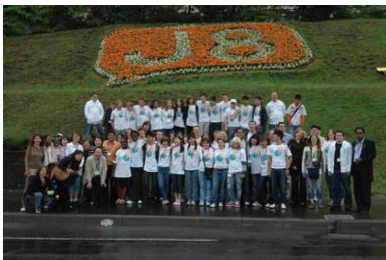
J8サミット2008千歳支笏湖