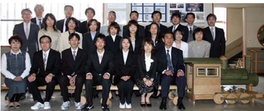
20年度教職員・山線型ベンチで