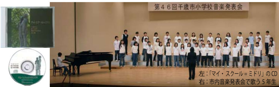
左:「マイ・スクール=ミドリ」のCD 右:市内音楽発表会で歌う5年生