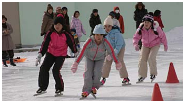
全力を尽くして、記録に挑戦 (スケート記録会5年生)

ただいたものと、たいへんありがたく思っています。このことに甘んじることなく、全職員がさらに努力を重ねていきたいと思っています。